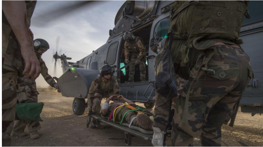
Figure 4. Soignants affectés à une évacuation sanitaire par hélicoptère de manœuvre en OPEX

Il faut ici souligner l'importance de la complémentarité des moyens d'évacuation pour traiter le soldat blessé entre moyens terrestres et moyens aéroterrestres. Dans le premier cas, il s'agit principalement du véhicule de l'avant blindé sanitaire (VAB SAN) : il dispose de grandes capacités de franchissement - ce qui permet d'arriver au plus près du blessé -, d'un blindage assurant une bonne sécurité et d'une adaptation issue des conflits asymétriques (à l'instar de l'Afghanistan) avec l'ajout d'armement ou la disparition des signes distinctifs médicaux 19 . Néanmoins, la capacité de transport de blessés reste relativement limitée dans la mesure où elle est théoriquement de quatre blessés couchés mais d'un seul cas grave couché en pratique afin de maximiser l'espace et le volume du matériel, le tout dans un confort sommaire et soumis aux aléas de la route. Dans le second cas, il s'agit de l'ensemble des hélicoptères de manœuvre (HM) sanitaires : ils ne disposent pas de la même protection balistique que les VAB SAN et sont soumis aux aléas météorologiques, mais ils sont évidemment plus rapides, avec une capacité d'emport supérieure - même face à des blessés graves 20 . Leur arrivée sur la zone d'évacuation diffuse une forme de sérénité parmi les soldats engagés, rassurés pour leur frère d'armes qui sont pris en charge et évacués vers les rôles 2 et 3 avec une certaine célérité.