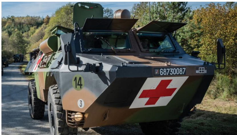
Figure 3. Véhicule de l'avant blindé sanitaire (VAB SAN) à l'entraînement

Dans ce cadre espace-temps contraint pour garantir la survie du soldat blessé, le concept français de « médicalisation de l'avant » prend tout son sens et repose en premier lieu sur le poste médical. Assurant le soutien direct de l'unité de combat à laquelle il est intégré, il est une petite structure composée a minima d'un médecin, d'un infirmier et d'un auxiliaire sanitaire, formée pour agir en milieu hostile et au plus près du combattant blessé. Cette proximité avec les autres soldats renforce la cohésion générale du groupe, la confiance mutuelle et, in fine , le moral au combat 18 . Cet aspect psychologique dépend entre autres de