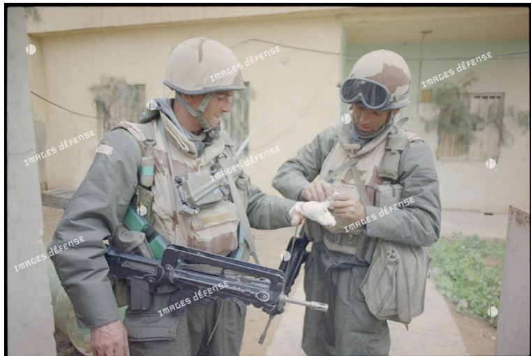
Figure 1. Un marsouin du 3 e RIMa soigne un camarade blessé à la main lors de l'opération Daguet (26 février 1991)

Le traitement des blessés au combat demeure, au fil des siècles, une constante qui permet de mettre en lumière la solidarité qui anime les soldats d'un même camp. Déjà, dans le poème homérique, comme le décrit Marine Remblière, « cette solidarité passe avant tout par des gestes soignants, de « premier secours » - à l'image d'Agénor bandant Hélène - et des attitudes, voire des stratégies protectrices, vis-à-vis du blessé, afin de le faire évacuer en toute sécurité 10 ». Le premier contact avec le soldat blessé est évidemment celui de ses coéquipiers, de ses frères d'armes qui l'accompagnent lors de la mission donnée 11 , tandis qu'il est admis que 90 % des morts au combat le sont car ils n'ont pas encore été pris en charge dans une structure médicale 12 . Ce fait justifie à lui seul l'importance accordée à la formation aux premiers secours des militaires engagés en opérations. La doctrine du Service de santé des