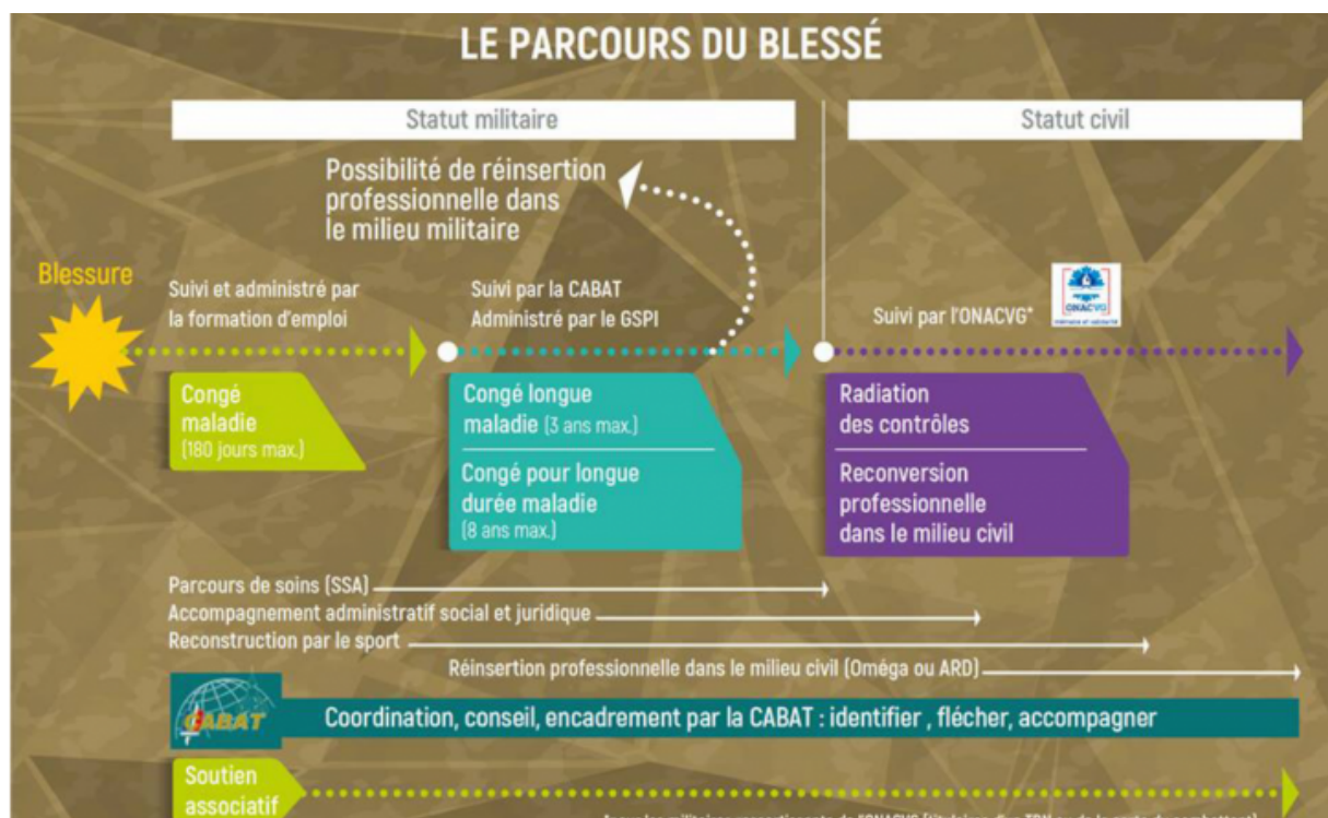
Figure 6. Le parcours du blessé encadré par la CABAT

C'est d'autant plus vrai pour le blessé psychique qui, contrairement au blessé physique dont la réinsertion ou la reconversion arrive après le parcours de soins, reste « en reconstruction 32 » lors de son retour vers le monde civil. C'est à leur destination, eu égard au fait que l'Agence de reconversion de la Défense (ARD) manque de temps pour leur accompagnement, que la CABAT a mis en place l'opération Oméga depuis 2013. Il s'agit, en complément du suivi médical, de favoriser leur réinsertion sociale et leur reconversion en s'appuyant sur des stages au sein d'entreprises partenaires. Du reste, ce dispositif s'appuie principalement sur le centre de ressources des blessés de l'armée de Terre (CReBAT) situé à Beuil dans le Mercantour, où, lors de sessions d'un peu plus d'une semaine 33 , une dizaine de volontaires vivent et participent à des activités physiques en commun en valorisant leur esprit de corps, puis en développant leurs projets professionnels. D'autre part, des dispositifs complémentaires de réhabilitation sociale des blessés psychiques sont apparus ces dernières années, à l'instar des maisons Athos. Ce projet, initié dès le début de l'année 2021, vise à créer des lieux spécifiques de repos et de soutien pour les blessés 34 dont les journées sont rythmées par diverses activités (randonnées, cuisine, etc.) facilitant leur réapprentissage de la vie avec autrui. Il existe à ce jour trois maisons Athos 35 pour des séjours allant de quelques jours à plusieurs semaines.