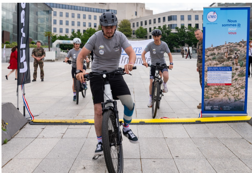
Figure 5. Défi cycliste organisé lors de la JNBAT à Paris, le 19 juin 2021

acteurs associatifs (à l'image de l'association pour le développement des œuvres d'entraide dans l'armée, ADO) qui financent les actions de la CABAT. Ces dernières sont de natures très diverses comme par exemple celles qui sont incluses dans la question de la « reconstruction par le sport » : les Rencontres militaires blessures et sports (RMBS) organisées tous les ans pour permettre de rompre l'isolement, les stages Sport mer et blessures (SMB) à destination des blessés amputés ou encore les stages d'équitation adapté pour les blessés psychiques et physiques au Centre national des sports de la défense (CNSD - Fontainebleau). Des actions qui sont valorisées, en parallèle de la communication officielle forte sur l'importance accordée au soutien des blessés, lors de la Journée Nationale des blessés de l'armée de Terre (JNBAT), un évènement créé par le général Bosser (alors chef d'état-major de l'armée de Terre - CEMAT) en 2017.